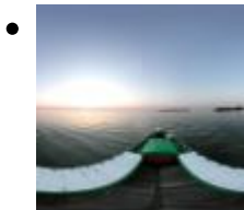
Parc Natural de l'Albufera [9]