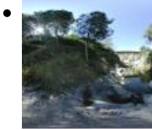
El Pou Clar [7]