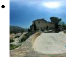
Plaza entrada al Castillo de Guadalest [1]

El castillo de Guadalest, colgado en lo alto de una peña y protegido por la antigua muralla conserva todo su sabor medieval y desde él se puede contemplar el caserío encajado en l...