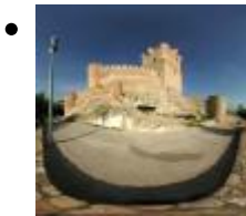
Castillo y ciudad de Villena [4]