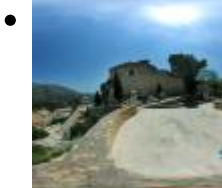
Plaza entrada al Castillo de Guadalest [1]

El castillo de Guadalest, colgado en lo alto de una peña y protegido por la antigua muralla conserva todo su sabor medieval y desde él se puede contemplar el caserío encajado en l...