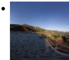
Parc Natural del Desert de les Palmes [2]