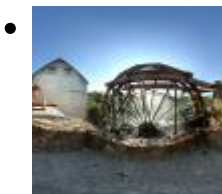
Noria Casas del Río [6]