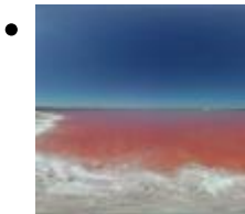
Parc Natural de La Mata-Torrevieja [5]