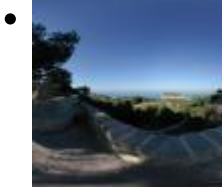
Bahía del Portixol [3]