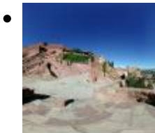
Castillo y pueblo [8]